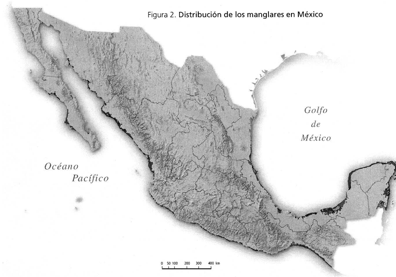
Figura 2. Distribución de los manglares en México

Los ecosistemas de manglar están presentes en los 17 estados de la República con litoral. El estado de Campeche es el que posee la mayor superficie de manglar del país (29.9%), seguido por Yucatán, Sinaloa y Nayarit (12.2, 10.8 y 10.2%, respectivamente). Los estados con menor cobertura fueron Colima, Tamaulipas y Baja California. Los valores obtenidos están por debajo de los datos proporcionados en las Series I, II y III de INEGI, que reportan cifras de entre 900 000 y poco más de un millón de hectáreas. Estas diferencias se deben, entre otras razones, a que en cada ejercicio se utilizaron distintos insumos, distintos métodos y escalas cartográficas diferentes. Por ejemplo, para la Serie I se utilizó la interpretación de fotografías aéreas y se realizó la verificación de campo, mientras que en el realizado por Conabio se utilizan imágenes de satélite (tabla 3).