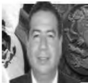
Dip. Ricardo Mejía Berdeja

Asimismo, participaron en forma activa como integrantes con carácter sustituto, en función del Acuerdo relativo a las Sesiones y al Orden del Día, aprobado por la Comisión Permanente el 27 de diciembre de 2012, los siguientes legisladores: