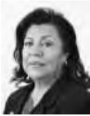
Sen. Martha Palafox Gutiérrez PT Tlaxcala