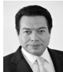
Sen. Mario Martín Delgado Carrillo PRD Distrito Federal