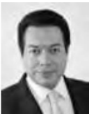
Sen. Mario Martín Delgado Carrillo PRD Distrito Federal