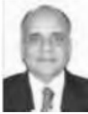
Dip. Manuel Añorve Baños PRI Guerrero