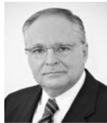
Sen. Miguel Romo Medina PRI Aguascalientes