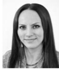
Sen. Gabriela Cuevas Barron PAN Distrito Federal