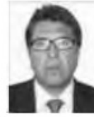
Dip. Ricardo Monreal Ávila MC Distrito Federal

Asimismo, participaron en forma activa como integrantes con carácter sustituto, en función del Acuerdo relativo a las Sesiones y al Orden del Día, aprobado por la Comisión Permanente el 27 de diciembre de 2012, los siguientes legisladores: