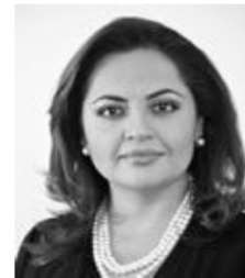
Sen. Ana Lilia Herrera Anzaldo PRI México