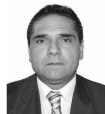
Dip. Silvano Aureoles Conejo PRD Michoacán