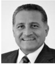
Sen. Arturo Zamora Jiménez PRI Jalisco