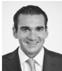
Sen. Luis Armando Melgar Bravo PVEM Chiapas