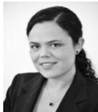
Sen. Mariana Gómez Del Campo Gurza PAN Distrito Federal