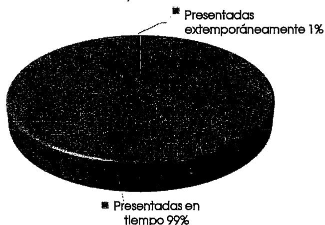
Nivel de cumplimiento en la Presentación de Declaraciones de Modificación de Situación Patrimonial y posible conflicto de Interés mayo-2016.

En la siguiente gráfica se detalla el nivel de cumplimiento reportado: