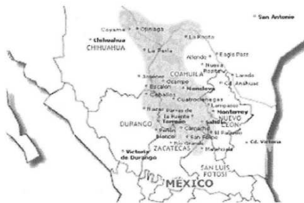
*Mapa de los estados en donde se ubica la planta candelilla. 2

Las flores aparecen de febrero a agosto, siendo más común entre marzo y abril en el centro y sur del estado de Coahuila. Durante época de lluvias, los tallos de la candelilla se llenan de una savia espesa, la cual en épocas secas recubre el tallo con cera para evitar su desecación. 1 En este sentido, la mejor época para su aprovechamiento se realiza principalmente entre los meses de octubre a junio, y la producción natural es de 189.3 kilogramos por hectárea.