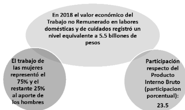
Figura 2. Cuenta satélite del Trabajo no Remunerado de los Hogares 2018 6

Como se observa, en la figura 1, las mujeres destinan 50.1 horas semanales, mientras que los hombres dedican 17.5 horas. Es decir, las mujeres en comparación con los hombres, dedican 32.5 horas más de trabajo no remunerado para las tareas del cuidado.