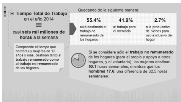
Figura 1. Trabajo no remunerado de los hogares porcentaje de distribución por sexo