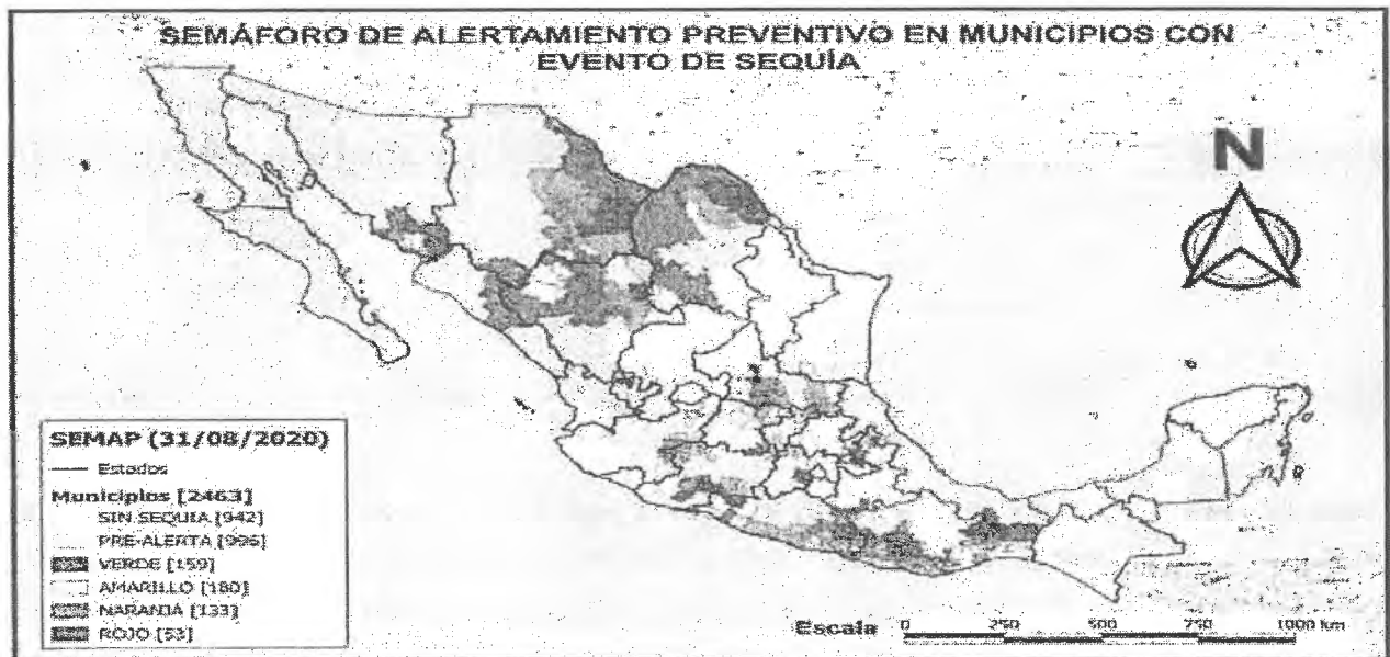
Figura 2.- Mapa del Semáforo de Alertamiento Preventivo en municipios con evento de sequía en México con corte al 31 de agosto de 2020.