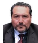
Sen. José Alejandro Peña Villa MORENA Lista Nacional