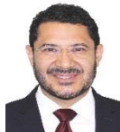
Sen. Martí Batres Guadarrama MORENA Ciudad de México