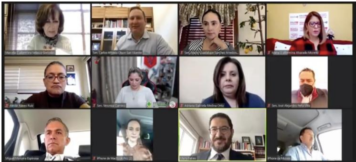
Integrantes de la comisión en reunión virtual de trabajo