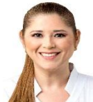
Sen. Verónica Noemi Camino Farjat PVEM Yucatán