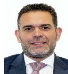
Dip. Jorge Arturo Argüelles Victorero PES Morelos