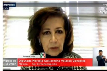
Presidenta de la Comisión