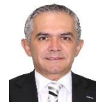
Sen. Miguel Ángel Mancera Espinosa PRD Lista Nacional