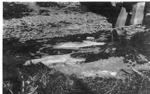
Figura 3. Vertido de aguas residuales crudas de la cabecera municipal de San Miguel de Allende, hacia el Arroyo de Las Cachinches, afluente directo de la Presa Ignacio Allende. (Imagen tomada el 05/01/2022).

Todo el trabajo que se tiene programado está estructurado para incidir en los factores que favorecen y detonan la proliferación de malezas acuáticas, como es el caso del lirio acuático, y con ello evitar que año con año se tenga esta invasión en la presa, de tal forma que no se altere su uso, se puedan realizar las actividades recreativas, así como las de subsistencia de los pobladores a través de la pesca.