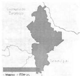
Víctimas de Femicidio & Homicidio doloso de 0 a 17 años en Nuevo León México por entidad, 2022 (año/s)