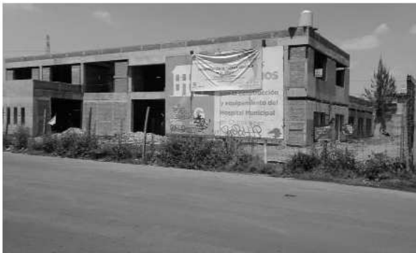
Por: La silla rota

Otra obra que está en las mismas condiciones es el centro integral de Oncología del Estado de México, localizado en el municipio de Ecatepec 10 .