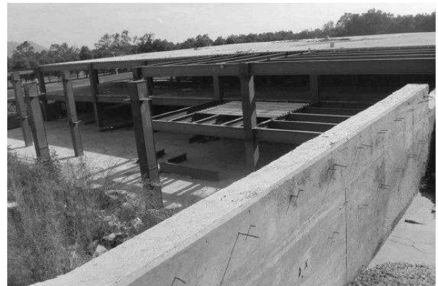
Por: Ana Salazar. Milenio

En el caso del Hospital Tlalnepantla Valle Ceylán, se construyó en tres etapas. Dicho proyecto inicio en enero de 2013, con una asignación de federal de $ 142,454,633.36, la segunda etapa con aportación federal de $ 131,970,000.04, y la última con asignación estatal de $ 129,949,126.44 y $ 25,282,411.27. Sin embargo, no se concluyó la construcción, a pesar de los constantes incrementos con el argumento de ser un hospital que albergara diversas especialidades.