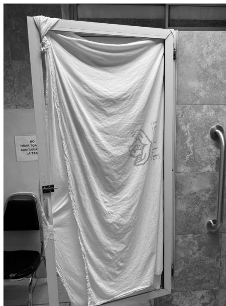
Febrero 2022, Hospital Regional Monterrey del Issste

La mayoría de los niños, niñas, adultos mayores, etc. que acuden a los hospitales y/o institutos pertenecientes a salubridad, Insabi, ISSSTE o IMSS no cuentan con recursos para solventar el pago de hospitales privados, pero esto poco le importa a la actual administración. El deterioro generalizado de los hospitales en todas las regiones del país es cada día más evidente. Muestra clara de este deterioro es la situación que atraviesa el Hospital Regional Monterrey del ISSSTE, donde la escasez de recursos e infraestructura ha llevado a que médicos reemplacen puertas con batas quirúrgicas.