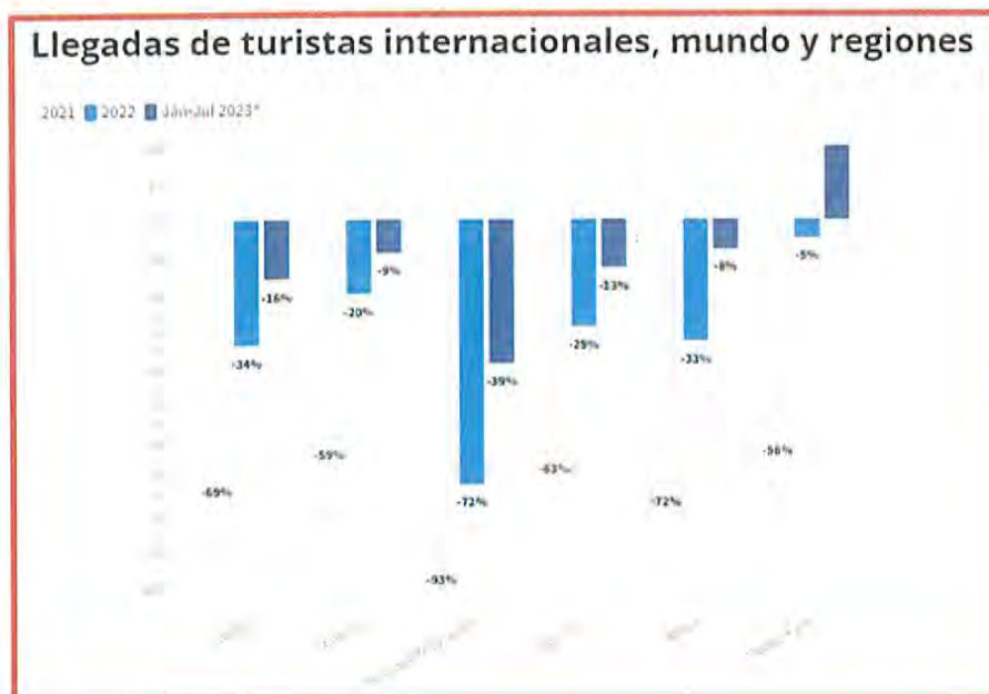
OMT % de cambio respecto a 2019. Publicada el 19/09/2023 en https://bitly.ws/VaGQ

Resultado de lo anterior, fue una recuperación firme como lo demuestra la siguiente gráfica, no obstante lo complicado del entorno económico y geopolítico.