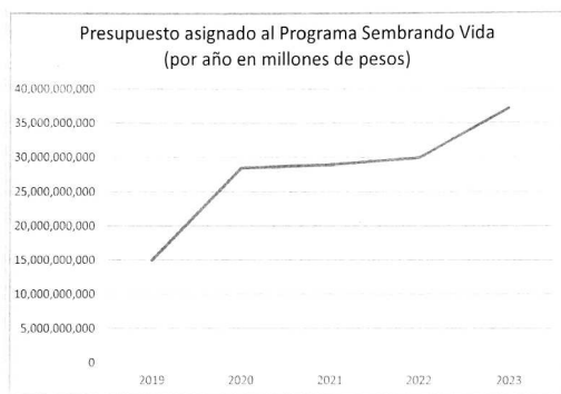
Figura 1: Elaboración propia basada en los presupuestos de Egreso de la Federación desde el 2019-2023. 4

de la población mexicana. Sin embargo, para el Ejercicio Fiscal 2023, el presupuesto aprobado fue de 37,065,993,063.00 millones de pesos, pese a la falta de resultados del programa. En la siguiente gráfica se puede observar el aumento del presupuesto que se le ha asignado al programa desde el año 2019: