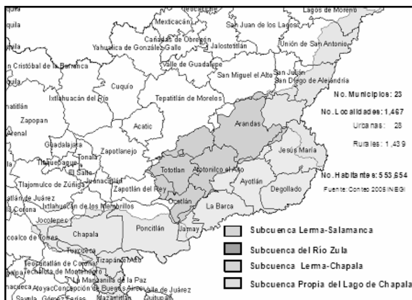
Figura 2. Subcuencas del Lerma Chapala en el estado de Jalisco.

La subcuenca del Duero se localiza se ubica en las coordenadas 19^{\circ} 40'' y 20^{\circ} 15'' latitud norte y 101^{\circ} 45'' y 102^{\circ} 45'' longitud oeste. Se encuentra delimitada al norte y al oeste por la subcuenca Chapala, al sur por la región hidrológica número 18 Balsas y al este por la subcuenca del río Angulo. En esta subcuenca se encuentran dos de las grandes ciudades de Michoacán, Zamora de Hidalgo y Jacona de Plancarte.