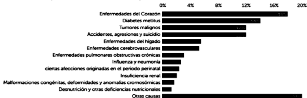
Gráfica 1 Principales causas de mortalidad general en México, 2012 (% muertes totales)