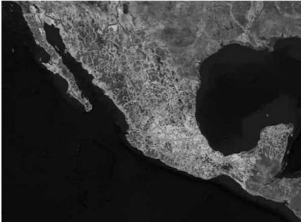
Imagen Satelital con RNC. Secretaría de Comunicaciones y Transportes. (2018).

Contar con una red desarrollada de caminos es un objetivo prioritario en cualquier país. Ésta permite que la región sea más dinámica, productiva y competitiva; en tanto que habilita a cientos de mexicanos para realizar de forma óptima sus actividades diarias. Mantenerla, sin embargo, representa también una importante responsabilidad para el Estado mexicano, en tanto es su deber realizar los mejores esfuerzos con el fin de evitar daños ambientales como los que aquí se han expuesto.