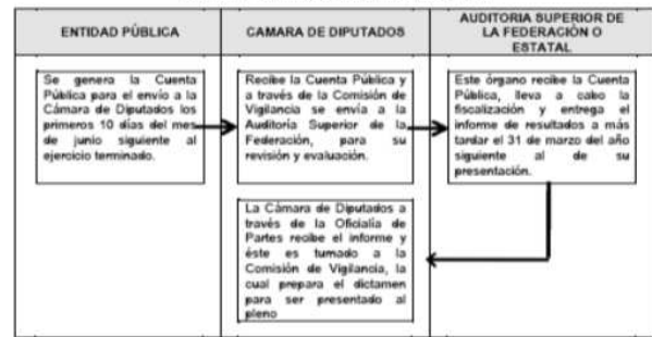
Cuadro 1: Proceso de Fiscalización

Fiscalización Externa: a la Cámara de Diputados del honorable Congreso de la Unión por mandato constitucional le corresponde la revisión de la Cuenta Pública, y ésta la lleva a cabo a través de la Comisión de Vigilancia turnándola a la Auditoría Superior de la Federación.