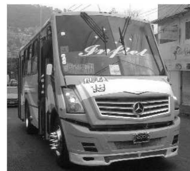
Imagen 1. Camión Hitta 18 Cuauhtemoc. La Villa.

De lo anterior, llama la atención que en el reglamento de tránsito de Ciudad de México, los aditamentos no estén especificados ni su tamaño, forma ni material de elaboración, y es por eso que vemos circular día a día camiones de pasajeros, microbuses y transporte de carga con los capuchones cubre birlos de picos en los rines de las llantas, los cuales en la mayoría de los casos son de metal y se consideran altamente peligrosos tanto para los automovilistas y peatones, así como el propio conductor; ya que, en caso de un siniestro, la aseguradora puede rechazar el pago si estos camiones llegaran a pegar con esta parte, pues los birlos de picos pueden generar mayor daño a un tercero si se impacta con esta parte, los cuales deberán ser pagados por la aseguradora (Seguros Hcid, 2016).