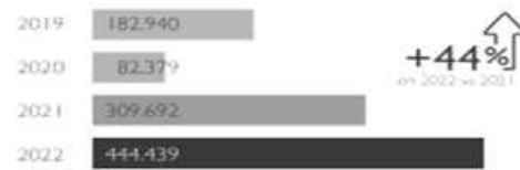
MIGRACIÓN IRREGULAR EN MÉXICO 7 5. Eventos de personas en situación migratoria irregular 8 registrados por la autoridad migratoria mexicana, 2019 – 2022

El año 2022 presentó el mayor número de eventos de personas en situación migratoria irregular jamás registrado en México, superando las cifras récord registradas en 2021.