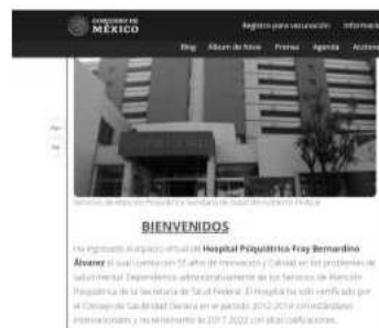
Ilustración 1 Captura de pantalla de la página del Gobierno de México

Es de importancia señalar que el problema no radica en la falta de pericia de los hospitales. El Hospital Psiquiátrico Fray Bernardino Álvarez cuenta con 55 años que lo respaldan, en los cuales se ha destacado por su innovación y calidad en los problemas de salud mental, sumado a que cuenta con certificaciones del Consejo de Salubridad General y con estándares internacionales, lo cual incluso se encuentra plasmado en la página del Gobierno de México. 8