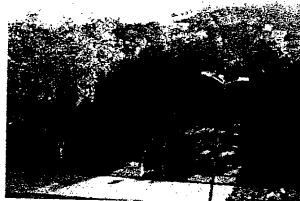
Interior del ANP, equipamiento del parque