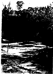
Interior del ANP, equipamiento del parque