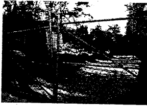
Acceso principal al ANP (Av. Circunvalación)