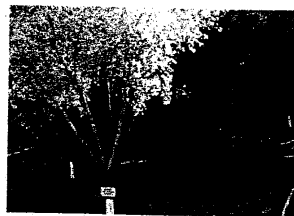
Área delimitada con malla ciclónica dentro del ANP (denunciada).