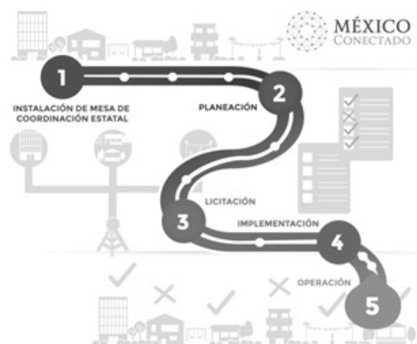
Imagen 1. Cinco fases del Programa México Conectado 5 .

México Conectado llevará internet de banda ancha a los sitios y espacios públicos de todo el país. Para ello, en cada estado de la República se sigue un proceso que consiste en cinco fases como se muestra en la imagen 1.