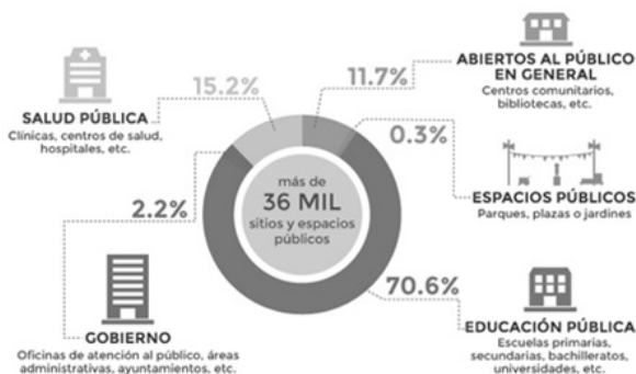
Imagen 2. Estadística. Puntos de Acceso 9 .

Según reportes de la Secretaría de Comunicaciones y Transportes, el proyecto México Conectado llevaba instalados 65 mil 145 puntos de acceso a internet de banda ancha gratuita por todo el territorio nacional hasta el 24 de febrero de 2015 7 , pero siendo que la meta fue de 200 mil se tendría que ver los alcances del mismo programa 8 . Según los datos de la Coordinación para la Sociedad de la Información (CSIC) los puntos con acceso a internet de banda ancha gratuito se encuentran distribuidos como se muestra en la imagen 2, donde podemos observar que los espacios públicos casi no han sido tomados en cuenta en este programa.