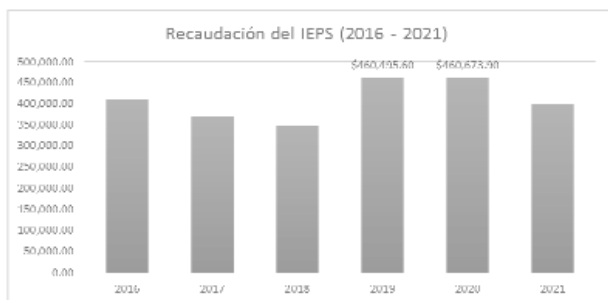
Tabla 3. Evolución del IEPS (2016 - 2021), elaboración propia con información de SHCP y SAT.

Hoy, a inicios del 2022, la economía de México se encuentra estancada, el ingreso por persona se encuentra a la baja, en la tabla 4 podemos apreciar como en el segundo trimestre de 2021 el PIB per cápita se encuentra por debajo del que se tenía en el primer trimestre de 2020. Sumado a esto nuestro país desde 2021 con una inflación de 7.5 por ciento, la más elevada en los últimos 20 años, revisar: “México despidió el 2021 con la inflación más alta en dos décadas”, 2022.