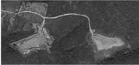
Imagen Obtenida de Google Earth