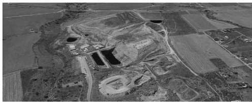
Imagen Obtenida de Google Earth

El sitio se halla en la calle 30 de septiembre S/N, Colonia Ampliación Hermenegildo Galeana, en el municipio de Cuautla, instalación de planta de separación de residuos valorizables con tecnología alemana, en la que actualmente se trata 27,766.75 ton/m 3 de residuos sólido-urbanos y de manejo especial. Actualmente, cuenta con una fosa de lixiviados, descarga de drenaje, disposición final de sitios no valorizables, arrastre de partículas suspendidas, alimentador de planta, plataforma primaria y secundaria de triaje, tromel de criba, separador balístico, separador férrico, separador óptico y separador inductivo.