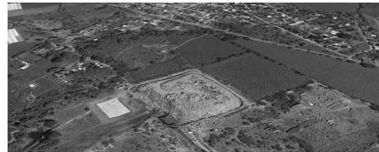
Imagen Obtenida de Google Earth

El sitio se halla al Noroeste de la ciudad de Yautepec, por la carretera que conduce a Tepoztlán. Se ubica en el paraje “Ojo Seco”. El relleno sanitario actualmente cuenta con 3 celdas, la celda tres se encuentra en operación, la celda dos fue clausurada —sin embargo, se está volviendo a utilizar— y la celda 1 actualmente también está clausurada. El camino de acceso al relleno sanitario se encuentra con escasa vigilancia. A la entrada del relleno sanitario se observan zanjas por donde escurre el lixiviado de los residuos, ya que no hay una correcta canalización. No existe un sistema de captación y extracción de lixiviados, además de que la fosa se encuentra en obra negra y contiene dentro estancamiento de lixiviados con una capa de residuos. Como resultado de que no se encuentra en operación, la fosa de lixiviados no hay recirculación de estos o tratamiento.