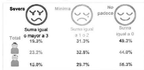
Figura 7. Población según síntomas de ansiedad.

Nota: Las cifras pueden no sumar horizontalmente 100, debido al redondeo.