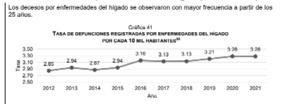
Ilustración 2. Defunciones por enfermedades del hígado por cada 10 mil personas

Lo pavoroso de la información que se muestra en la ilustración 1 es que al no existir estrategias políticas que promuevan una atención y prevención eficiente de la Ehgna, las defunciones detonadas por las enfermedades asociadas a la Ehgna seguirán aumentando hasta un punto de un incremento exponencial que llegará afectar a una gran parte de la población, causando un colapso en el sistema de salud. Un ejemplo de esto es el fallecimiento por enfermedades del hígado, las cuales desde el año 2012 presentó un incremento constante hasta el año 2021, tal como se muestra en la ilustración 2. Entonces, si la Ehgna continua con una tendencia de crecimiento, ocasionará que las enfermedades del hígado lleguen a niveles críticos que podrían impactar gravemente a la salud pública y privada, a la sociedad, la economía, las comunidades y al gobierno.