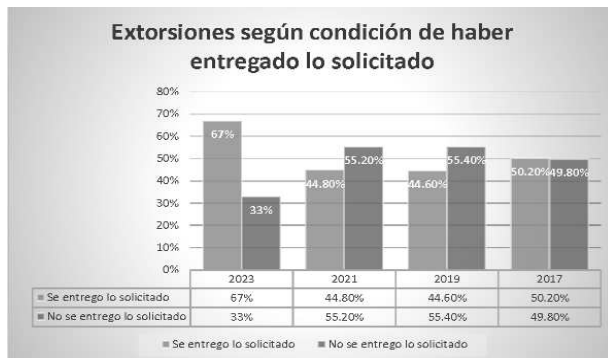
Gráfica elaborada con datos de Encuesta Nacional de Victimización de Empresas (ENVE) 2024

En 2022 el costo de este delito fue de 3 mil 339 pesos por persona, lo que significa un aumento del 54 por ciento respecto a 2021, 3 esto repercute en la competitividad, en el acceso a los bienes y servicios de los consumidores, es decir en el bolsillo de todos los ciudadanos. 4