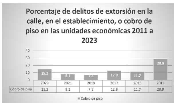
Gráfica elaborada con datos de Encuesta Nacional de Victimización de Empresas (ENVE) 2024

Durante 2023, se cometieron 747 mil delitos de extorsión. De estos, 113 mil correspondieron a delitos de extorsión en la calle, en el establecimiento, o cobro de piso. En 67.0 por ciento de los casos, se entregó lo solicitado. 6